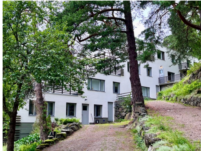
Alvar Aallon Terassitalo.