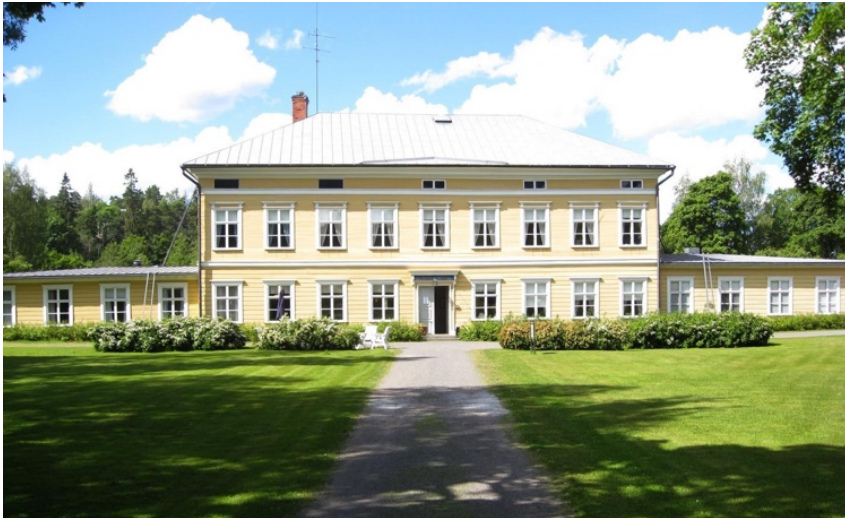
Kartanon ravintola palvelee meitä kurssin aikana.

Pienen kävelymatkan päässä on lisää Aaltoa: funktionalistinen Terassitalo, jota pidetään yhtenä hänen merkittävimmistä töistään. Vuonna 1938 valmistunut Terassitalo on alun perin suunniteltu Kauttuan tehtaiden ylemmille toimihenkilöille.