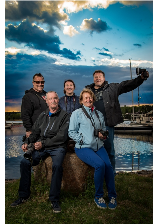
Ryhmäkuva kahdella salamalla.