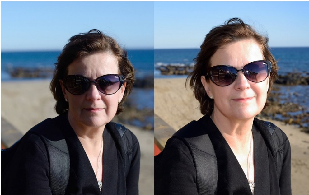
Pelkkä aurinko - salamalla täydennetty