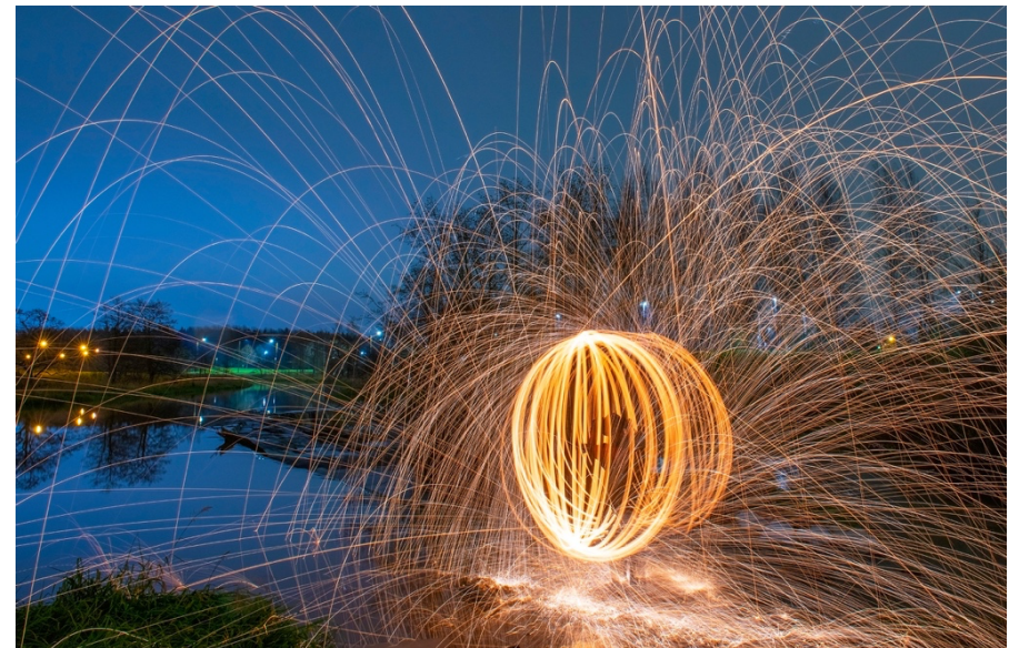
2 Valomaalausta palavalla teräsvillalla.