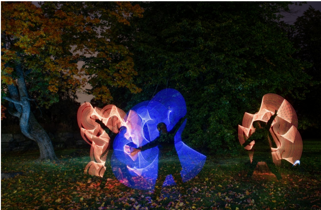
3 Valomaalausta led-valoilla.