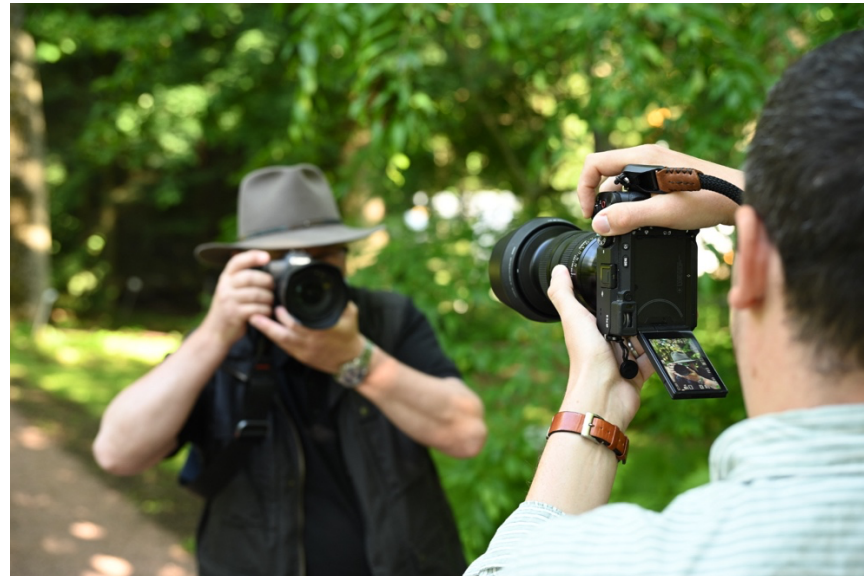
...ja Helsingin kasvitieteellisessä puutarhassa.